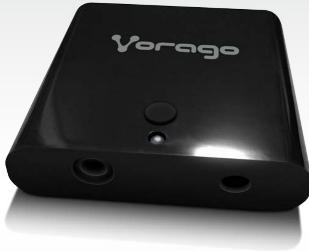
SPEAKER ADAPTER 200