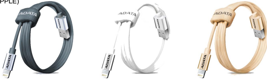
Variedad de colores , el cable se puede enrollar fácilmente y llevarlo a donde quieras