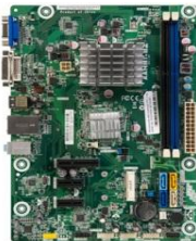
figura 1: Vista superior de la placa base