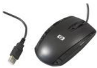
figura 8: Vista superior del ratón