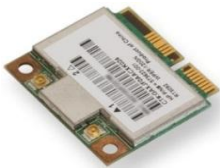
figura 2: Vista superior de la tarjeta inalámbrica

Tipo de interfaz: Minitarjeta PCI-E de media altura