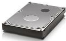
figura 3: Disco duro