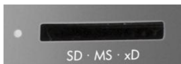
figura 5: Vista del lector de tarjetas de memoria