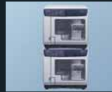
La solución ideal para todo tipo de desempeño en grabación e impresión de discos

Las cabezas de impresión MicroPiezo son el elemento central de las impresoras de inyección de tinta Epson. La tecnología MicroPiezo produce gotitas uniformes y estables de tinta, prácticamente sin satélites o nebulización. Es por ello que el Discproducer brinda la más alta calidad de impresión en su clase para obtener texto nítido y gráficos brillantes, con resolución de hasta 1440 x 1440 ppp. Además, sus cartuchos de tinta independientes de gran capacidad hacen que la impresión sea extremadamente asequible, con un costo estimado promedio de USA $.08 por disco. 1