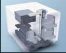
Sistema DiscProducer en detalle