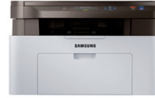
Xpress M2070 Multifuncional Monocromático (20 ppm)