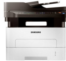
Xpress M2875FD Multifuncional Monocromático (28 ppm)