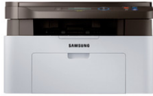
Xpress M2070W Multifuncional Monocromático (20 ppm)