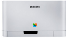
Xpress C410W Impresora Laser a Color (18 / 4 ppm)