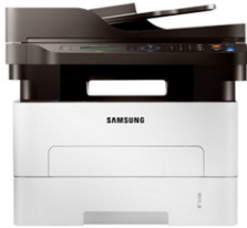
Xpress M2675FN Multifuncional Monocromático (26 ppm)