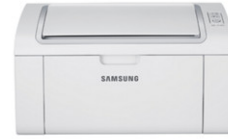
ML-2165 Impresora Laser Monocromática (20 ppm)