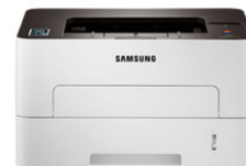
Xpress M2835DW Mono Laser (28 ppm)